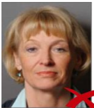
ombra sullo sfondo