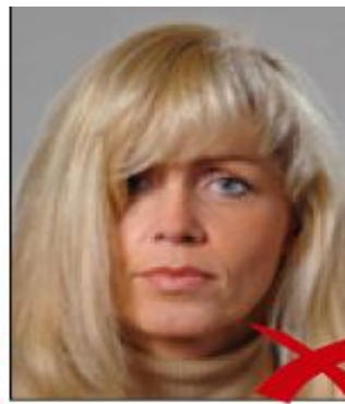
volto coperto dai capelli