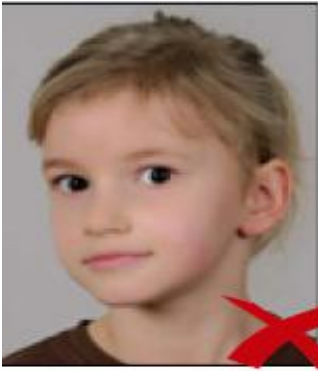
posizione del capo