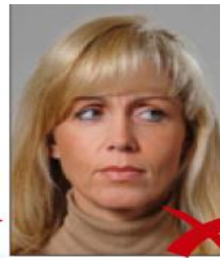
sguardo di lato