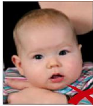
altra persona sullo sfondo