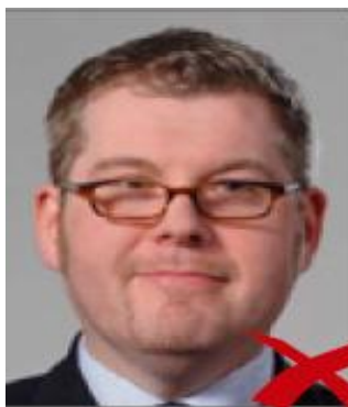
montatura copre gli occhi