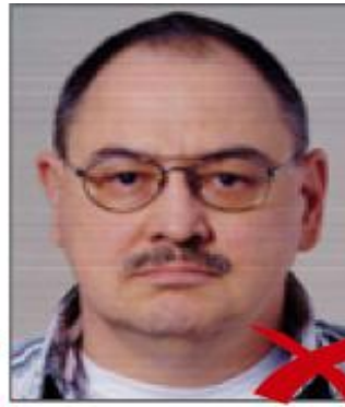
grana della pellicola