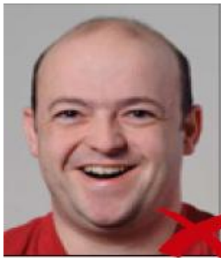
la bocca aperta