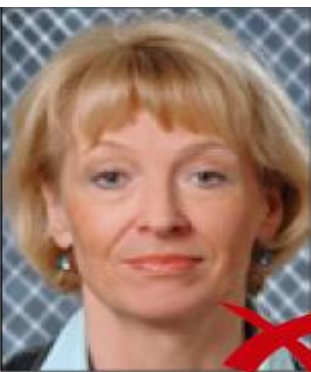
sfondo non uniforme