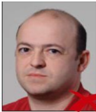
profilo ad u